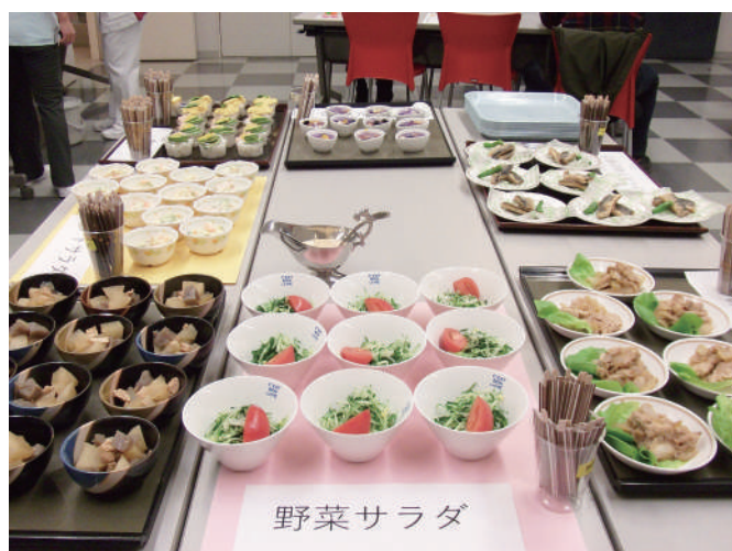
図1：バイキングのお料理

このような教室を年に12回開催しています。今後もスタッフで知恵を出し合い、新しい企画を考え、患者さんが糖尿病のことを楽しく学んで前向きに付き合っていけるよう、頑張っていきたいと思えます。