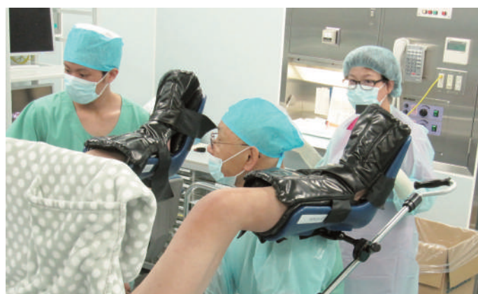
図 2：前立腺生検の風景