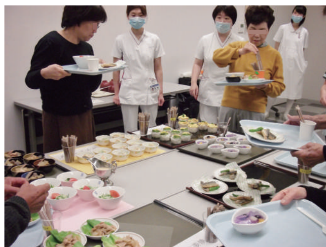
図2：お料理を選ぶ患者さんたち